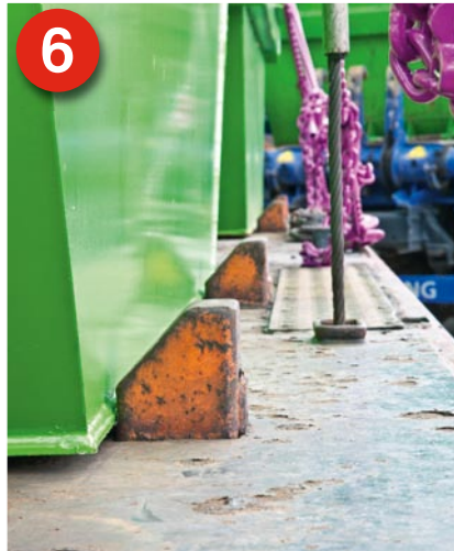
6 Die Anschläge sichern den Behälter zur Seite ab. Während die Schrägzurrung (siehe Bild 7) den Behälter in Fahrzeuginnenachse absichert.