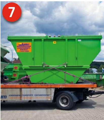
7 Ketten richtig angelegt: Die X-Verzurrung der beiden Ketten ist eine optimale Ladungssicherung in Richtung der Fahrzeuginnenachse.