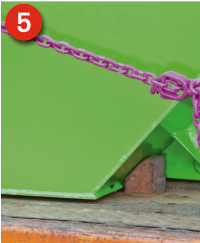
5 Sichern auf dem Anhänger: Auf dem Spezialanhänger sind die Behälter formschlüssig an die vorderen Anschläge herangestellt.