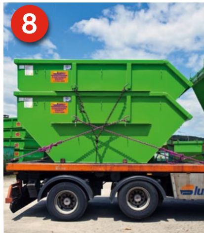
8 Gestapelte Behälter sind zu einer Ladeinheit zusammengefasst. Da der untere Behälter teilgefüllt ist, müssen zusätzliche Kräfte sichern.